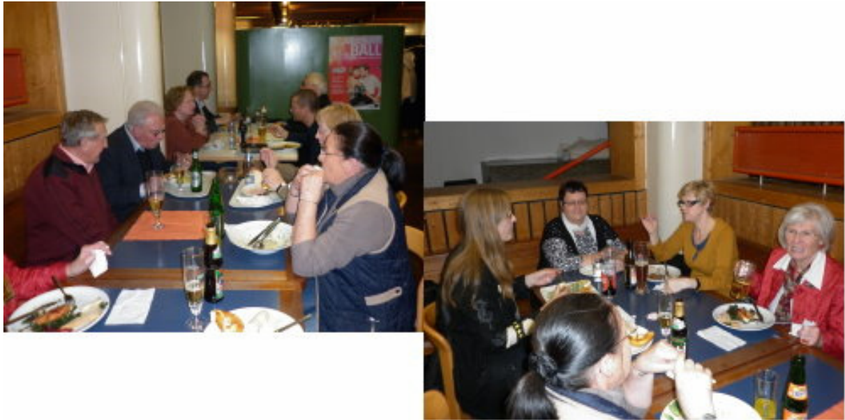
Gespräche in der Kantine

Nach dieser sehr interessanten Veranstaltung haben die Mitglieder des Freundeskreises die Möglichkeit zum gemeinsamen Besuch der Theaterkantine genutzt und den Nachmittag bei vielen Gesprächen ausklingen lassen.